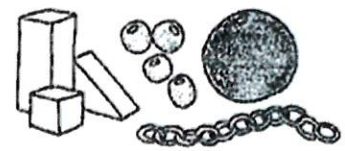
積み木、ボール、チェーンリング、木製ビーズなど